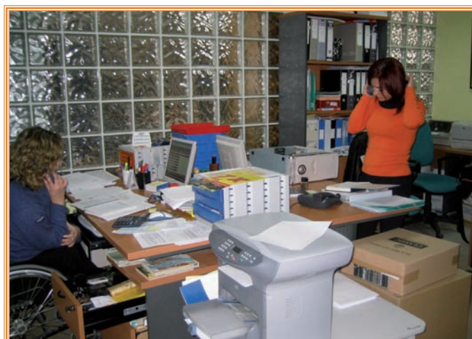
Las empresas necesitan recurrir a los organismos de apoyo a la innovación.

■ Las actividades de innovación tecnológica promovidas por estas asociaciones, que cuenten con una decidida participación empresarial en su financiación y gestión, deben ser apoyadas por la Administración.