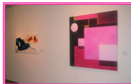
Vista parcial de la sala de exposiciones, con pinturas y esculturas del Certamen de la Fundación Campollano.