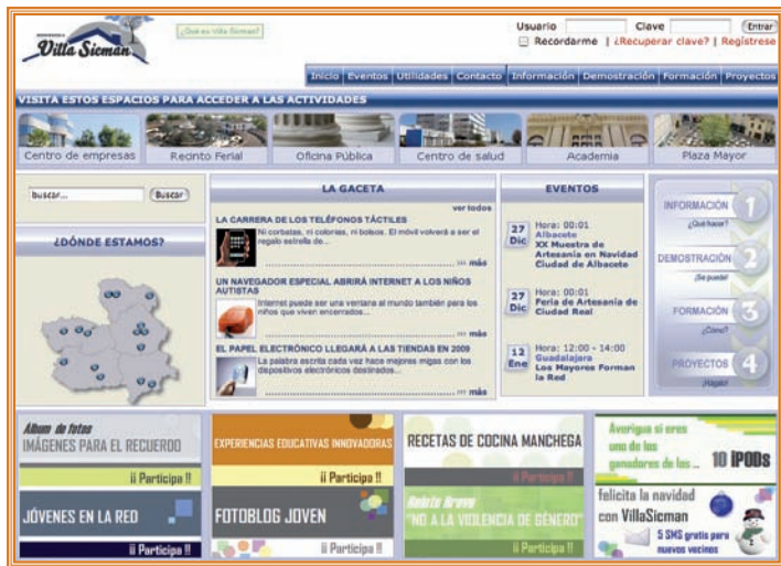
Página de inicio de Villa Sicman.

Los concursos para dar a conocer las ventajas de esta plataforma telemática diseñada como un pueblo virtual , han alcanzado un importante nivel de participación: Un total de 839 personas de las cinco provincias de Castilla-La Mancha han emitido su voto para elegir a los ganadores, de entre 121 trabajos que han sido publicados en Villa Sicman.