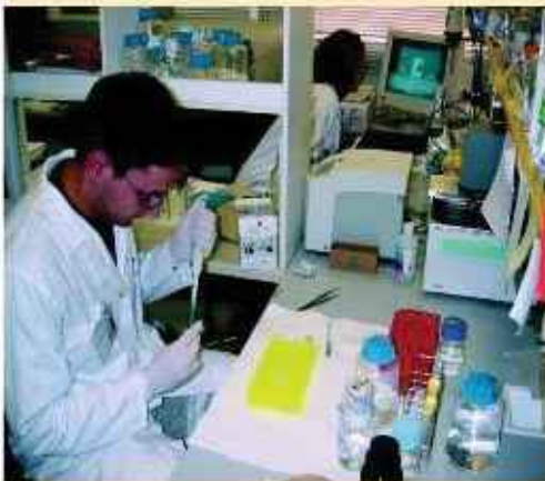
Cooperación entre la comunidad científica y la empresarial.

Además, se busca también superar el 29 por 100 de investigadores en el sector empresarial en el período de vigencia del Plan, así como incrementar en más de 3.000 las nuevas plazas y contratos de investigadores en el sistema público e incrementar en