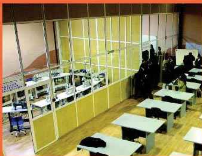
El centro dará un servicio integral a las empresas de Albacete y la provincia.

La Asociación de Empresarios de Confección de Albacete (Asecab), celebró el pasado día 4 de diciembre el acto de inauguración oficial del Centro de Innovación Tecnológica (CIT), que ha sido construido en el Polígono Campollano, con la firma