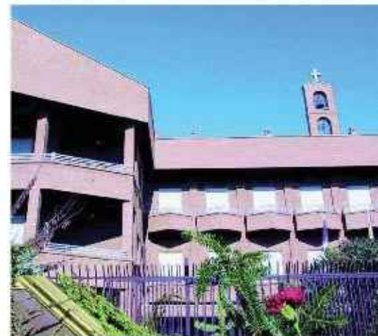
Asilo San Antón.

Durante el desarrollo del proyecto puede surgir la necesidad de realizar modificaciones en el mismo, que deberán ser comunicadas a la Fundación en los correspondientes informes razonados por la entidad beneficiaria.