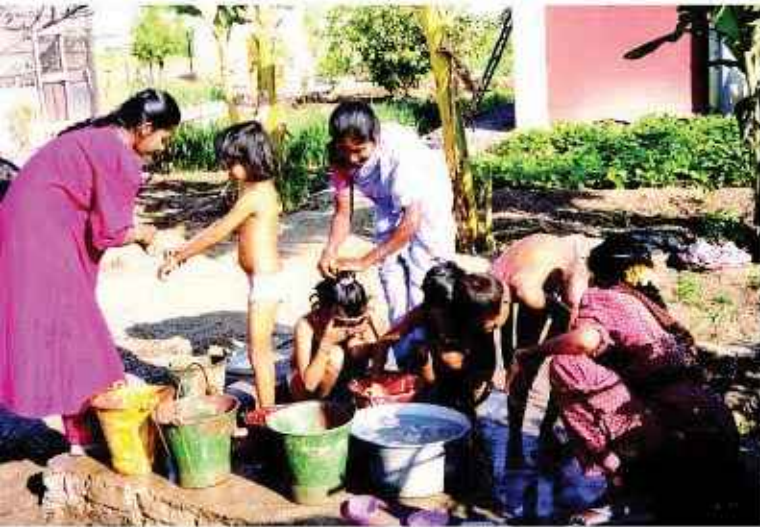
Las bases de la Convocatoria de Ayudas, así como los formularios y otros impresos para cumplimentar la documentación que se solicita, están disponibles en la sede de la Fundación, y en su Portal de Internet: www.fcampollano.org . En la imagen, proyecto de Manos Unidas.

actuaciones, actividades de ampliación de programas y proyectos ya existentes, así como la puesta en marcha de proyectos concretos dentro de programas ya iniciados.