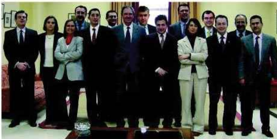
Nuevo Consejo de Dirección de la Universidad de Castilla-La Mancha, encabezado por el rector.

En la actualidad, si las cifras no me fallan, contamos con 15 ofertas de Master, 30 de Doctorado y 14 de Título de Especialista. Las áreas son prácticamente todas en las que tenemos conocimientos, Derecho, Economía, Química, Medio Ambiente, Literatura, Ingenierías, Humanidades, Filologías, Relaciones Internacionales, Derechos Humanos, Deporte, etc.