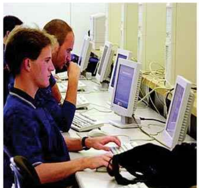
Se pretende elevar la capacidad tecnológica e innovadora de las empresas.

Se busca alcanzar en España una ratio de más de 29 empresas innovadoras por cada 100, frente a las 23,5 actuales.