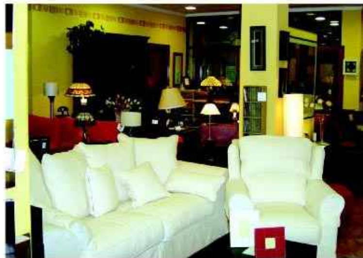
La Fundación se está dirigiendo a empresas de la madera y mueble, entre otros sectores

Como resultado final se obtendrá un informe confidencial para la empresa, que contendrá información de las tareas desarrolladas, las conclusiones, las acciones propuestas, su evaluación y las repercusiones de la incorporación.